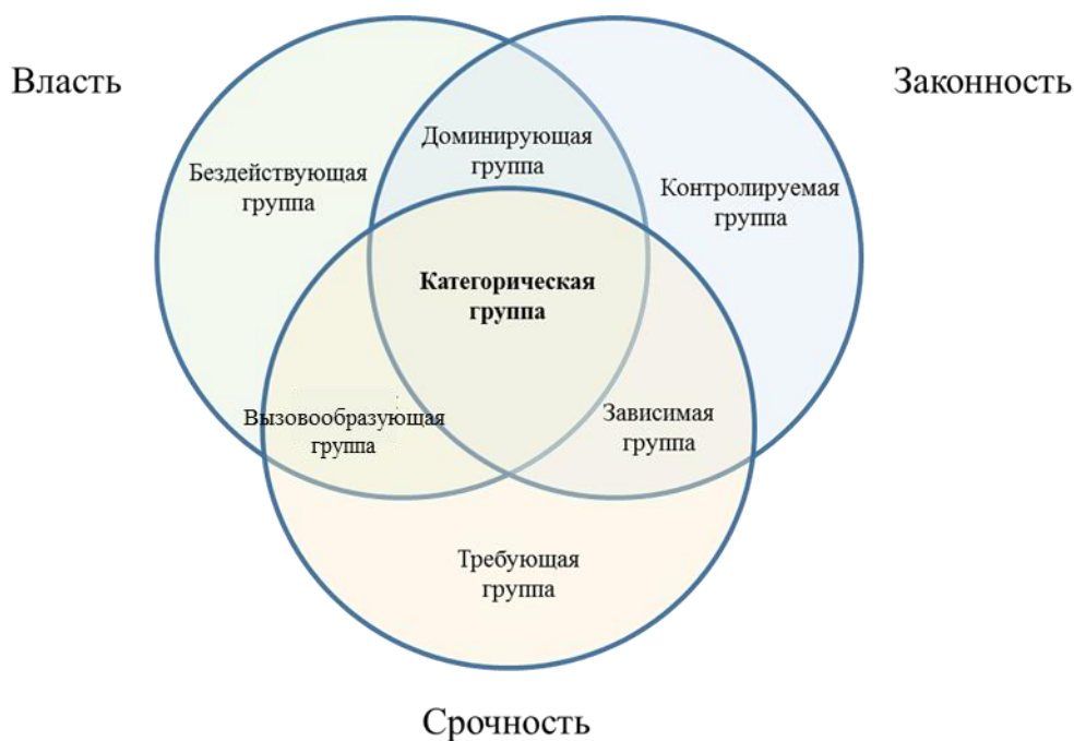
Рис.1 Модель Митчела, Агла и Вуда

В основе модели три фактора (рис. 1): власть (сила влияния заинтересованной стороны на предприятие), законность (юридическая легитимность отдавать указания) и срочность (минимально необходимая скорость ответов на запросы заинтересованной стороны).